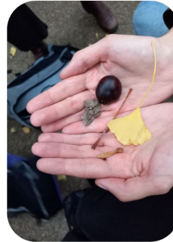
Éléments naturels du parc