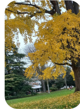
Ginkgo et pelouse