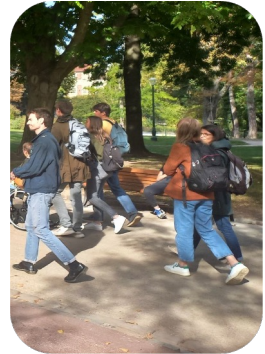
Etudiant.es dans le parc