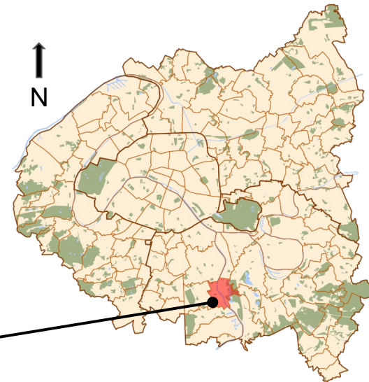
Choisy-le-Roi en petite-couronne.