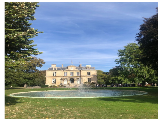
Parc de la Mairie avec bâtiment historique